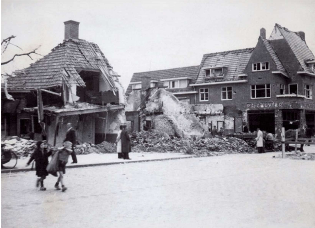
Foto: De Leenderweg voor het rijtje huizen met de bomkrater op straat. (Frans Gommers – Eindhoven in beeld)

Vier dagen later, op 23 september, werd Toon tijdens een massabegrafenis begraven op het kerkhof van de Sint Jorisparochie. Daar zijn foto's van, gemaakt door Ben Postema. De overledenen van het bombardement werden in vier lange rijen begraven. Toon ligt dicht langs de rand van het kerkhof; vak P, rij 4, nr. 17.