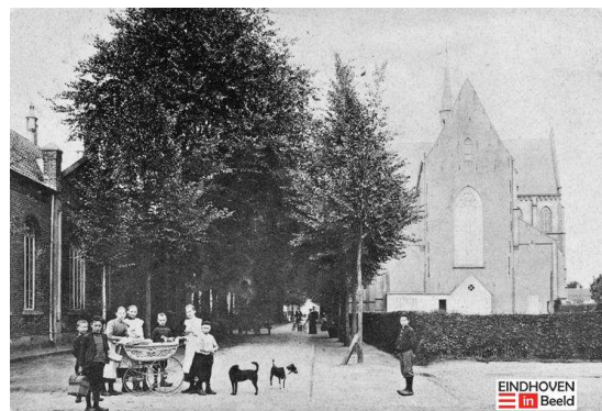
Foto: Sint Joriskerk zonder toren in 1903