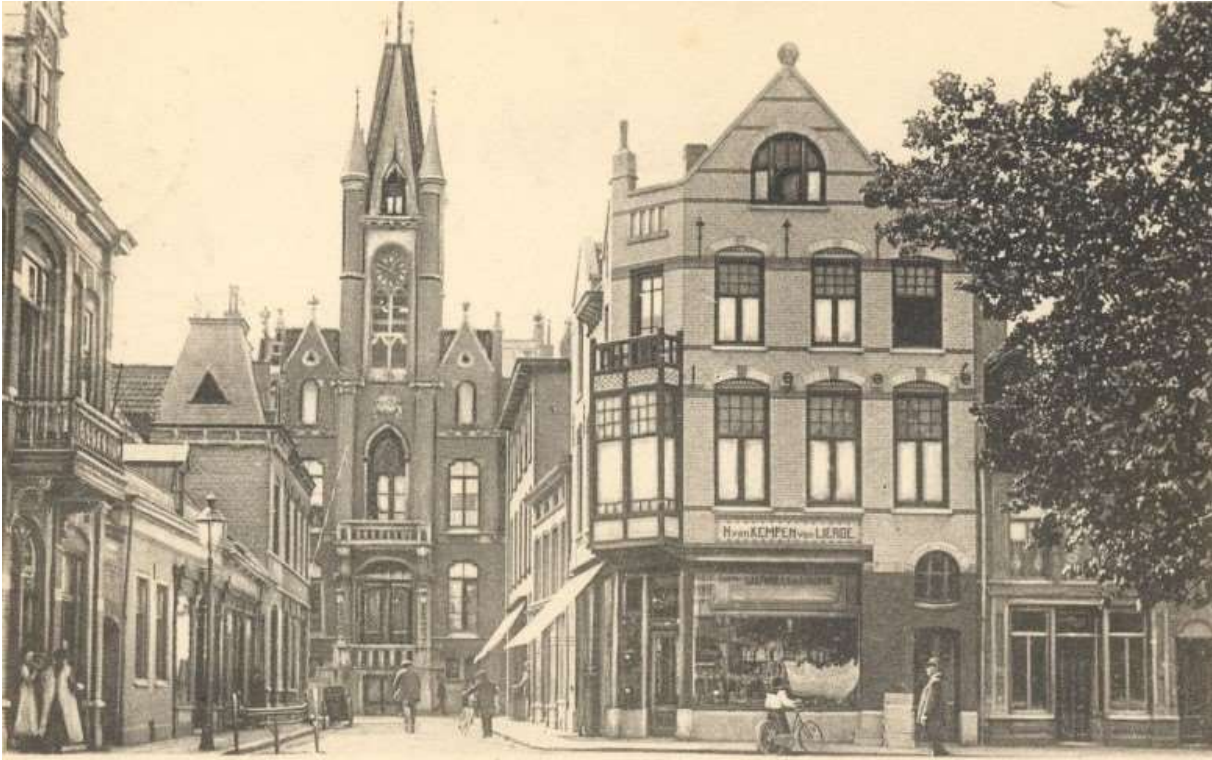
Foto: zicht op het stadhuis van Eindhoven via de Jan van Hooffstraat